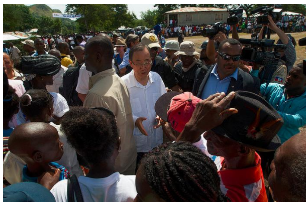
Le Secrétaire général des Nations Unies, Ban Ki-moon visite des familles victimes de l'épidémie de choléra à Las Palmas, le 14 juillet.

Conjointement avec S.E le Premier Ministre d'Haïti, le Secrétaire-général a lancé un programme d'assainissement national pour Haïti.