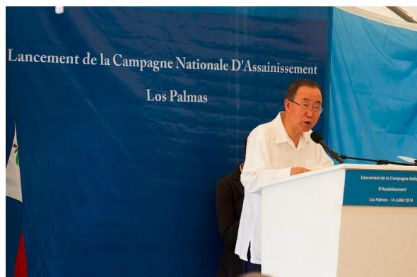
Le Secrétaire général des Nations Unies, Ban Ki-moon prenant la parole à l'occasion du lancement de la campagne nationale de l'assainissement le 14 juillet dernier à Los Palmas, Hinche, département du Centre. Crédit photo : Minustah insisté.

Au cours de sa visite les 14 et 15 juillet derniers, le Secrétaire-général des Nations Unies, Ban Ki-moon, s'est entretenu avec les autorités nationales, la population haïtienne et le personnel des Nations Unies sur les avancées dans la lutte contre l'épidémie de choléra.